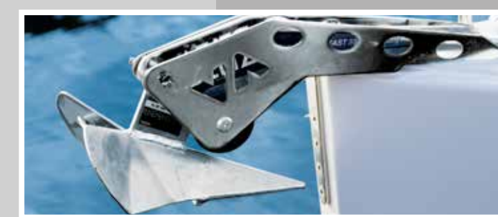
Anker mit Ankerkasten