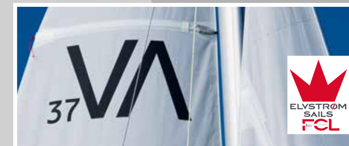
Elvström FCL Segel